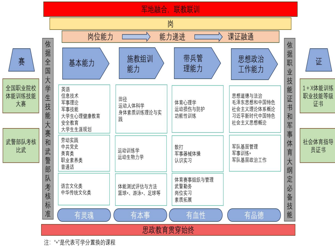
图 1 基于职业能力分析构建的课程体系