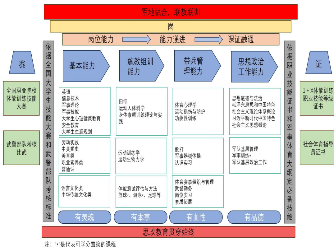
图 1 基于职业能力分析构建的课程体系